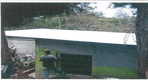
Foto1: colocacion de nueva lamina troquelada sustituyendo la anterior que esta totalmente dañada.