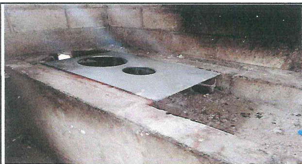
Foto 5: colcacion de ladrillo de base y nueva plancha para evitar fugas de humo y tener un lugar mas apto para cocinar