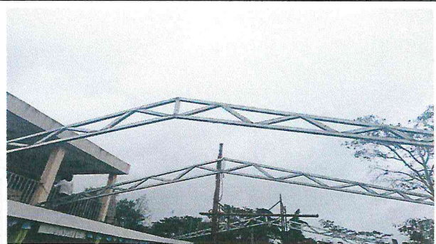
colocacion de nueva estructura de metal para colocar lamina troquelada nueva.