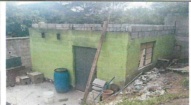
Foto 4: levantado de pared, y limpieza de muro exterior e interior de cocina previo a aplicacion de pintura nueva