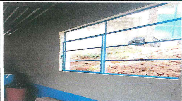
Foto 3: retiro de los vidrios quebrados, limpieza y pintura de marco, previo a colocacion de vidrios nuevos